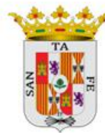
AYUNTAMIENTO DE SANTA FÉ