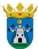
AYUNTAMIENTO DE ALHAMA